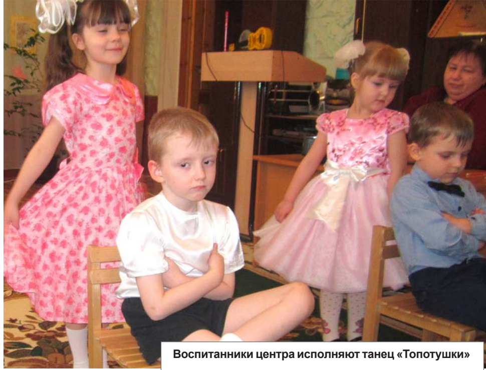
Воспитанники центра исполняют танец «Топотушки»

Здесь проходит привыкание детей с надломленными судьбами к простым правилам нормальной жизни. И проведение здесь совместного «круглого стола» с социальными службами района вполне закономерно. Основная его тема - проблемные вопросы в работе с несовершеннолетними из неблагополучных семей.